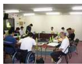
社員臨時総会開催 七月二六日 本年度 事業計画及び収支予 算案について臨時総 会を開催し了承され た。