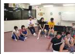
御代田町スポーツ少年団カーリング教室 八月九日