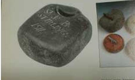
THE Joy of CURLIG より

このストーンは世界最古のストーン と言われている石です 歴史が感じられます。十六世紀永 正八年の物です。