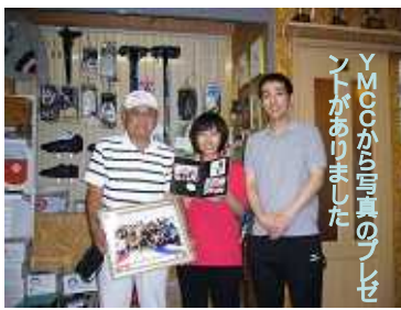
YMCCから写真のプレゼ ントがありました